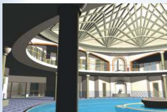
2006 - megnyitjuk!

Szigetvár páratlan szépségű vidékének természeti kincse a gyógyvíz. A mintegy 800 méter mélyről feltörő ásványi sókban és nemesgázokban gazdag 62 °C-os hévíz Magyarország egyik legjobb minőségű, legmagasabb hőfokú, a régió legbővebb hozamú, legszélesebb alkalmazási területtel rendelkező gyógyvize.